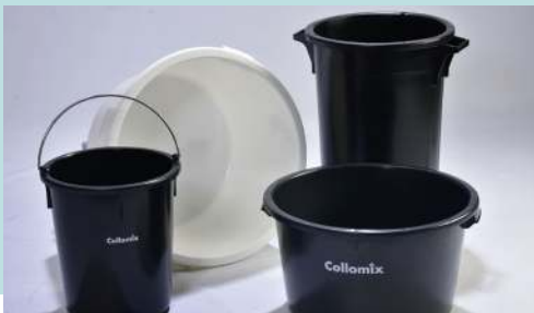
• Seau mélangeur •