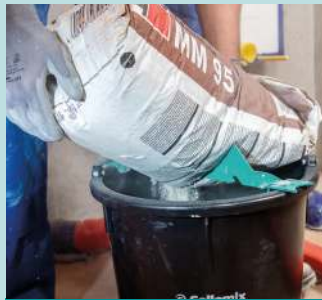
• Ouvre-sacs Sharky •