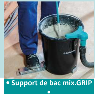
• Support de bac mix.GRIP •