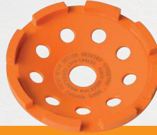
GST 125 Grinder