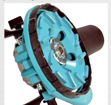
Geschlossener Lamellenring für staubarmes Arbeiten*