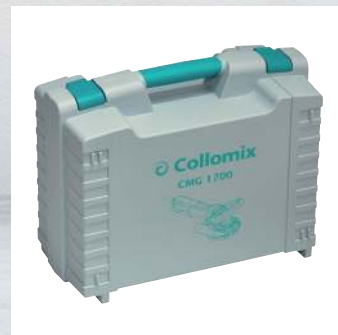
Robuster Koffer für sichere und handliche Verstaueung