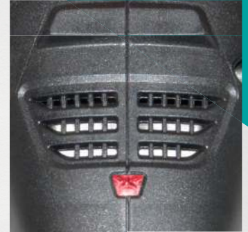
Optische Leistungsüberwachung als Überlastschutz