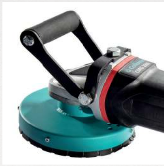
Komfortabler Griff für optimalen Halt und sicheres Schleifen