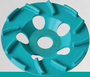
BST 125 Cyclon

für den Betonschleifer CMG 1700 (Ø 125 mm)