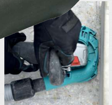
Praktische Segmentöffnung für randgenaues Arbeiten