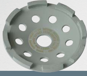
UST 125 Universal