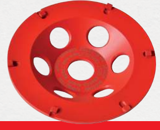
PST 125 Strap-it